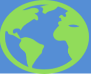
Схема направления граждан РК на лечение за рубеж за счет бюджетных средств